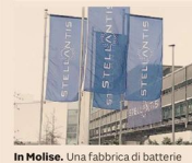
In Molise. Una fabbrica di batterie

I PROMOTORI La rete dell'istituto tedesco DB conta circa mille consulenti e ha una massa in gestione pari a 17 miliardi