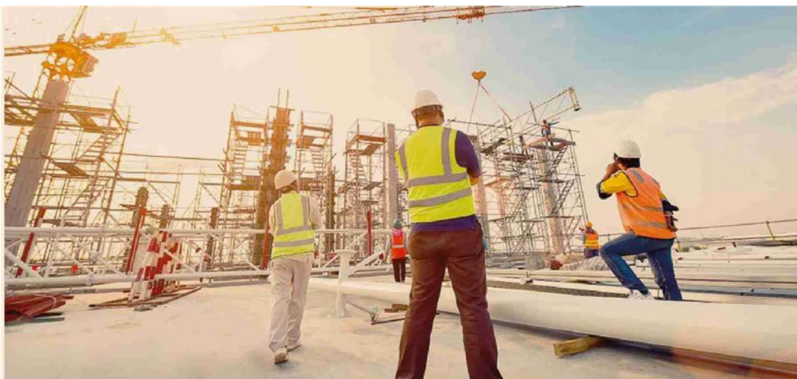
Costruzioni. L'Ance chiederà al governo un pacchetto di misure per favorire le assunzioni e la formazione dei giovani

Nelle costruzioni «la prospettiva è quella di un ritorno, a medio termine, ai livelli occupazionali registrati prima della crisi». Così il presidente dell'Ance