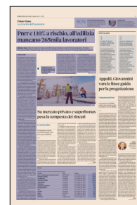
Peso: 1-7%, 3-43%